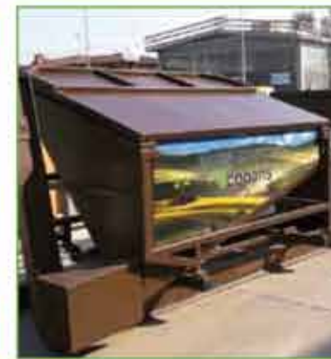
Carico con furgone Carga con furgón