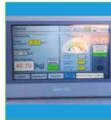
panelo LCD Pantalla LCD