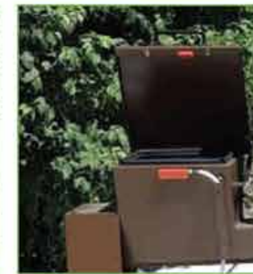
Carico manuale Carga manual